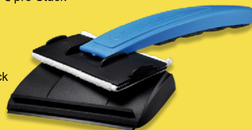
Option Logoprägung & Griff in Sonderfarbe

Option Prägung: - Stückpreise wie "ohne Aufdruck" - einmalige Formkosten 2.900,- Euro - ab 1.000 Stück Produktionsmenge